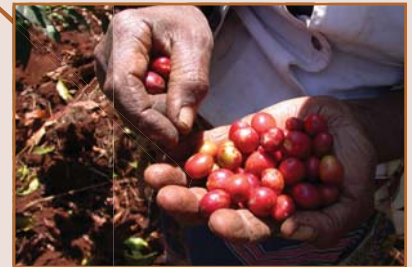
Projet de café Starbucks, Kenya