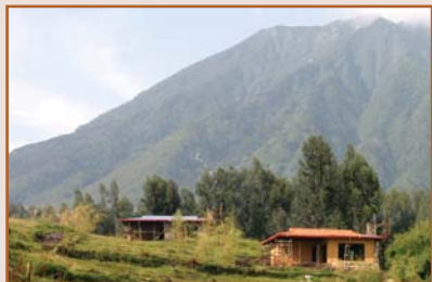
Pavillon Sabyinyo Silverback, Rwanda