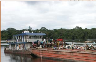
Projet bateau du Congo, RDC

AWF est sélective quant aux entreprises qu'elle soutient. Tous les projets passent par un processus de développement rigoureux mené par une équipe d'experts en planification commerciale, droit, écologie et développement communautaire. Les scientifiques de la conservation s'assurent que les projets contribuent à la conservation de la faune. Les experts socio-économiques étudient les avantages pour les communautés et les aspects culturels. Les problèmes juridiques sont étudiés avec rigueur. Les éléments commerciaux et financiers d'un projet sont scrutés à la loupe. Bien qu'un projet de conservation soit très intéressant, toute entreprise doit être jugée rentable pour obtenir le feu vert.