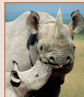
Rhinocéros noir ( Diceros bicornis )

AWF appuie la conservation des rhinocéros au Kenya, en Tanzanie et au Zimbabwe. Au Zimbabwe, où les rhinocéros de la zone protégée Sinamatella du parc national Hwange étaient menacés par les braconniers, AWF a participé au recrutement de nouveaux forestiers, et les a dotés d'équipement et de carburant nécessaires à la patrouille efficace de la zone. Aucun incident de braconnage de rhinocéros n'est donc survenu depuis juin 2004, et la population est en voie de récupération. Au Kenya, AWF a récemment favorisé l'expansion du sanctuaire de rhinocéros Ngulia, rendue nécessaire par la croissance de la population depuis sa création dans les années 80.