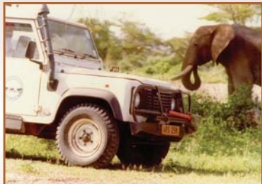
Alfred Kikoti étudie les éléphants en Tanzanie